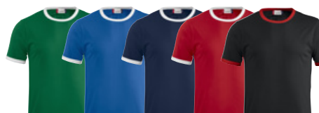
62/00 55/00 58/00 35/00 99/35