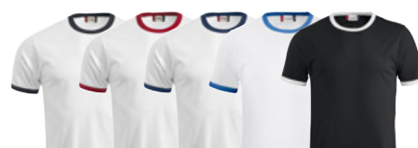
00/99 00/35 00/58 00/55 99/00

OEKO-TEX® CONFIDENCE IN TEXTILES STANDARD 100 SE 14-218 Swerea IVF Tested for harmful substances. www.oeko-tex.com/standard100