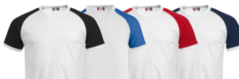
00/99 00/55 00/35 00/58