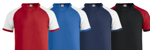
35/00 55/00 58/00 99/35